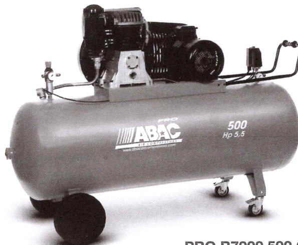
PRO B7000 500 CT 1010 hp, 500 litri