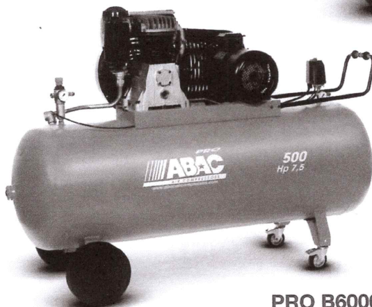
PRO B6000 500 CT 7,5,5 hp, 500 litri